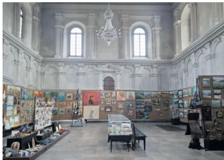
▲ Zadaniem artystów jest dostosowanie tematyki swoich prac do przewodniej myśli – Bieszczadzkie zadumania

„Praca ma sama w sobie przyciągnąć odbiorcę, a nie ktoś ma nas kierować ceną czy nazwiskiem.”