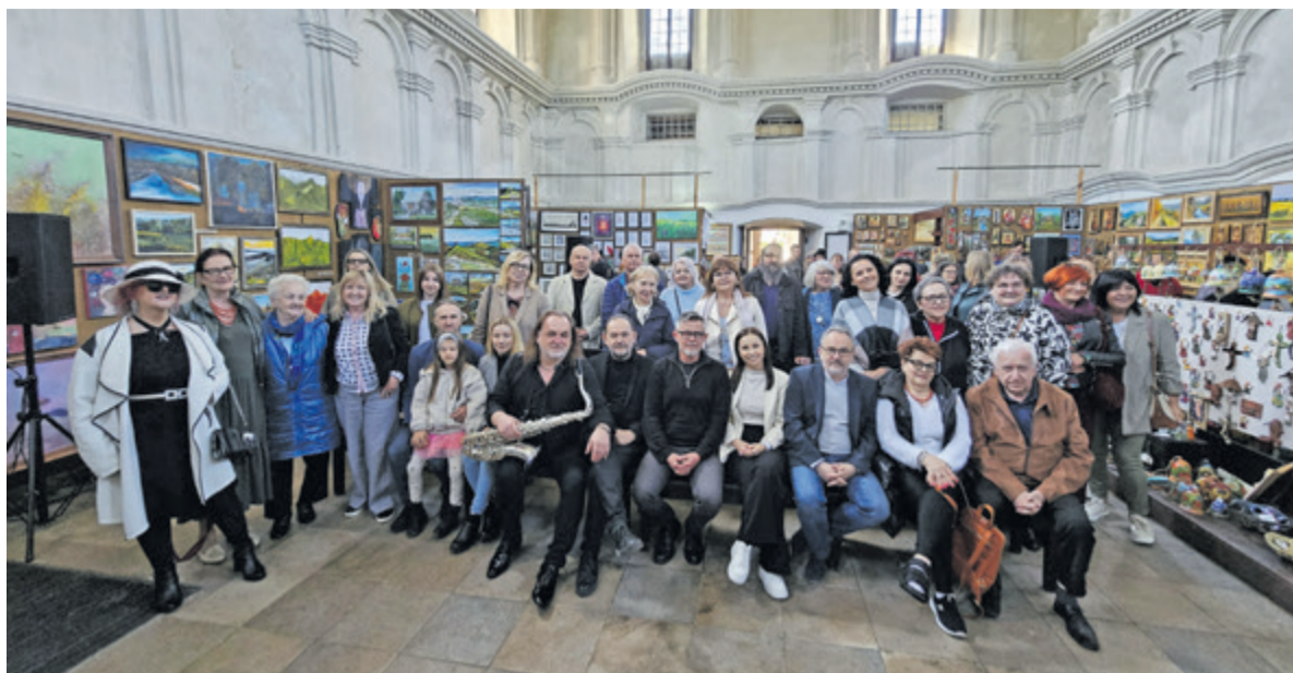
▲ Koncerty i wernisaże przyciągają zawsze rzeszę miłośników sztuki

Zawsze jak wchodzę w to miejsce, to zauroczona jestem akustyką.