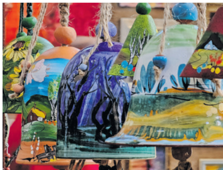
▲ W leskiej galerii znajdują się prace tylko artystów związanych z Bieszczadami

Gdyby tak miała Pani sięgnąć pamięcią wstecz do lat