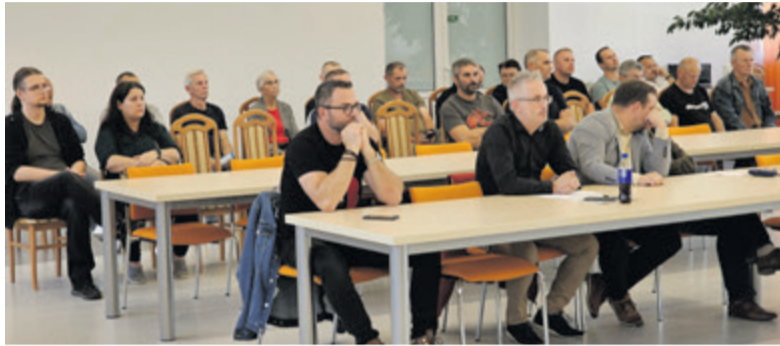
▲ Mieszkańcy gminy podczas sesji wyrazili swój sprzeciw wobec planowanej przez Polskie Koleje Linowe inwestycji

– Wiem, że większość zgłasza, że mam nadzieję ze mieszkańcy swoją determinacją doprowadzą