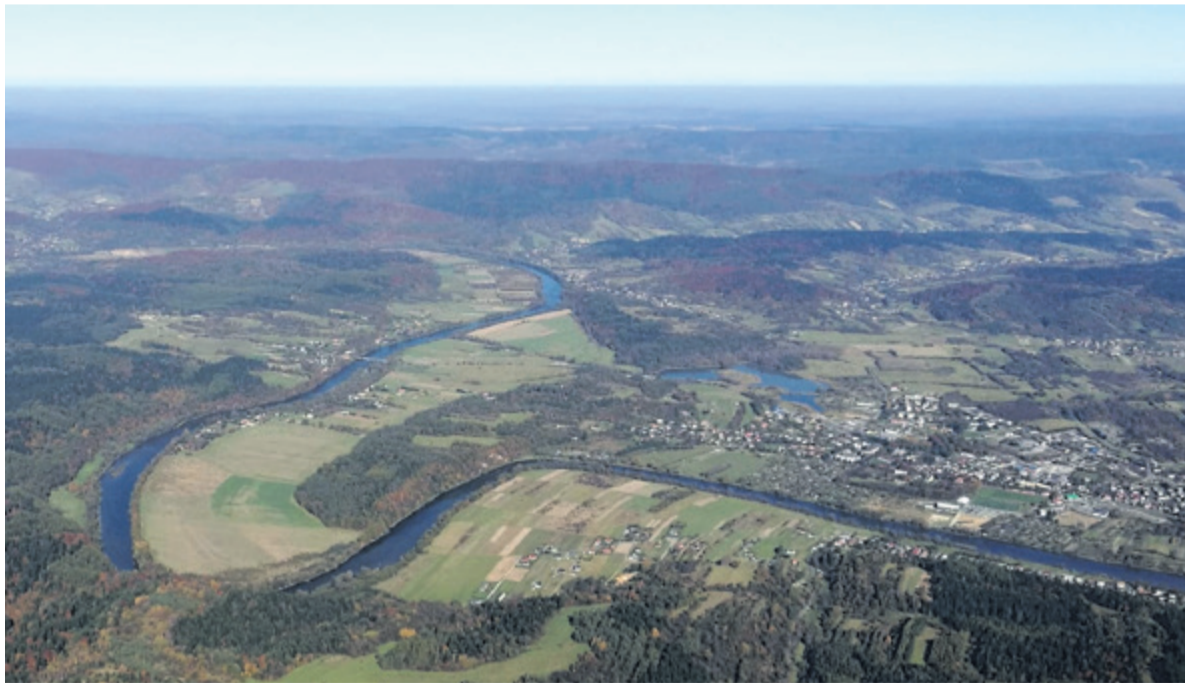
▲ Zakole Sanu w którym PKL planuje postawić park rozrywki to grunty należące do powiatu leskiego

Większość gruntów objętych zmianą należy do Powiatu Leskiego i to starosta zwrócił się o zmiany w dokumencie. Jak argumentował, ich potencjał inwestycyjny pozostawał dotąd niewykorzystany mimo wcześniejszego przeznaczenia pod rekreację i turystykę. Projekt został uzgodniony m.in. z Wodami Polskimi oraz jest zgodny ze wszystkimi obowiązującymi przepisami i z ustawą o planowaniu i zagospodarowaniu przestrzennym.