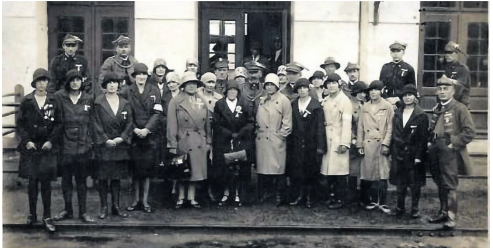
▲ Delegacja leskiego „Sokoła” przed wyjazdem do Lwowa lata 30. XX w.

W zbiorach Regionalnej Izby Pamięci w Lesku znajdują się dwa dokumenty, z których można prześledzić historię leskiego związku. Nakreślają one kwestie z jakimi Towarzystwo musiało się mierzyć na początku oraz przedstawiają uzupełniające się perspektywy założenia TG „Sokół” w Lesku. Pierwszym dokumentem jest roczne sprawozdanie z działalności Towarzystwa za rok 1899. Jest to prawdopodobnie pierwsze oficjalne roczne sprawozdanie z działalności TG „Sokół” w Lesku po jego formalnym założeniu. W nim możemy przeczytać: